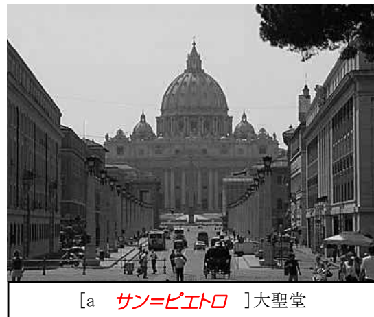
[a サン=ピエトロ ]大聖堂