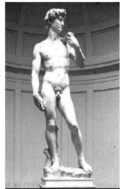
ミケランジェロ [cダヴィデ ]