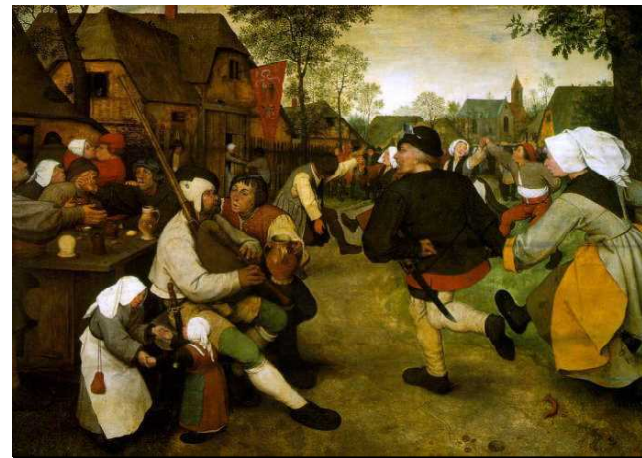
[d ブリューゲル ]「農民の踊り」

イ) ドイツ…[32 デューラー ]やホルバイン…肖像画、聖書を主題とした版画など