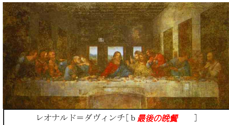
レオナルド=ダヴィンチ [b 最後の晩餐 ]